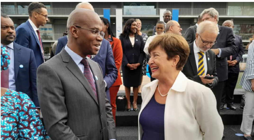
Waziri wa Nishati Mhe. January Makamba akijadili jambo na Mkurugenzi Mkuu Shirika la Fedha Duniani, Kristalina Georgieva baada ya Mkutano wa Viongozi wa Dunia wa mabadiliko ya tabianchi kwa Afrika.

mipango ya nchi katika kukabiliana na majanga yakiwemo UVIK019, ukame, njaa, ajira kwa vijana na mafuriko.