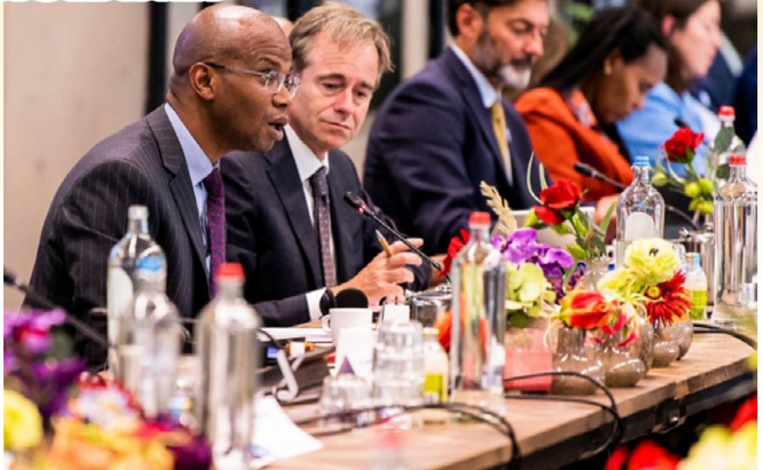
Waziri wa Nishati, Mhe. January Makamba akizungumza katika Mkutano wa Viongozi wa Dunia unaojadili Programu ya Afrika ya kukabiliana na Mabadiliko ya Tabianchi (Africa Adaptation Summit) uliofanyika Rotterdam, Uholanzi tarehe 5/9/2022. Waziri Makamba alimwakilisha Rais wa Jamhuri ya Muungano wa Tanzania Mhe. Samia Suluhu Hassan kwenye Mkutano huo.

Katika Mkutano huo, Waziri wa Nishati alikutana na Viongozi wa Dunia, Wakuu wa Taasisi na Mashirika mbalimbali na kujadiliana nao fursa mbalimbali ikiwa pamoja na namna bora ya Tanzania kunufaika na mpango huo wa AFRICA ADAPTATION ACCELERATION PROGRAM (AAP) ambao utaharakisha