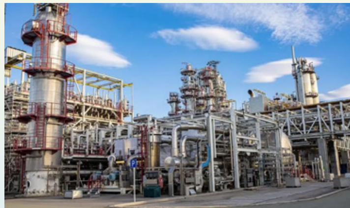
Baadhi ya mitambo katika mradi wa kuchakata na kusindika gesi asilia (Liquefied Natural Gas Plant - LNG) wa Equinor. Mradi huo upo Kaskazini mwa Norway kwenye mji wa Hammerfest.

Waziri wa Nishati, Mhe. January Makamba, pamoja na Balozi wa Tanzania kwenye nchi za Nordic, Mhe. Grace Olotu na Balozi wa Norway nchini Tanzania, Mhe. Elisabeth Jacobsen wakiwa kwenye mradi wa kuchakata na kusindika gesi asilia (Liquefied Natural Gas Plant - LNG) wa Equinor. Mradi huo upo Kaskazini mwa Norway kwenye mji wa Hammerfest.