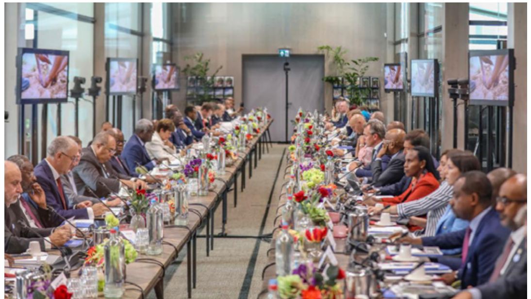
Sehemu ya Washiriki wa Mkutano wa Viongozi wa Dunia unaojadili Programu ya Afrika ya kukabiliana na Mabadiliko ya Tabianchi (Africa Adaptation Summit) unaofanyika Rotterdam, Uholanzi tarehe 5/9/2022. Waziri wa Nishati, Mhe. January Makamba amemwakilisha Rais wa Jamhuri ya Muungano wa Tanzania Mhe. Samia Suluhu Hassan, kwenye mkutano huo.