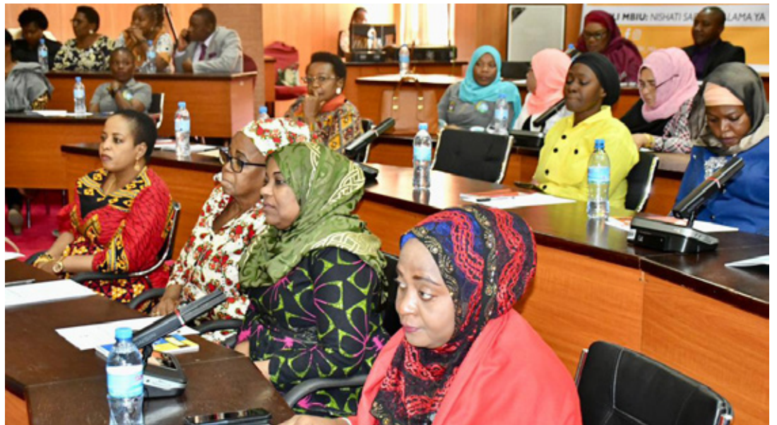
Sehemu ya Wabunge Wanawake wakifuatilia Hotuba ya Waziri wa Nishati, Mhe. January Makamba (hayupo pichani) wakati wa Semina Maalum ya Kuwajengea Uwezo Wabunge Wanawake kuhusu Nishati Bora ya Kupikia vijijini iliyofanyika jijini Dodoma.