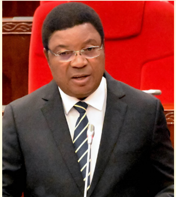
Waziri Mkuu, Mhe. Kassim Majaliwa

Alisema Serikali ya Tanzania inaungana na Serikali ya Uganda kuwahakikishia wadau wote likiwemo Bunge la Umoja wa Ulaya na Jumuiya ya Kimataifa kuwa mradi huo unatekelezwa kwa kuzingatia sheria zote za Tanzania na za Kimataifa, uwazi, tahadhari za kimazingira, ulinzi wa mifumo ya kiikolojia na rasilimali za maji,