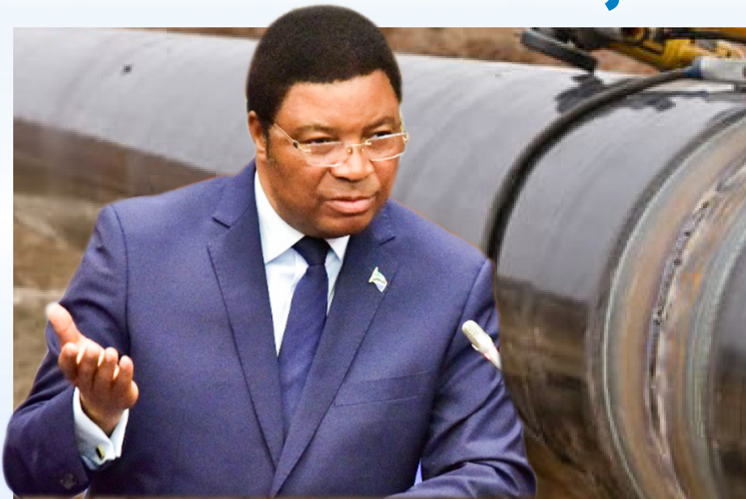
Waziri Mkuu wa Jamhuri ya Muungano wa Tanzania, Mhe. Kassim Majaliwa